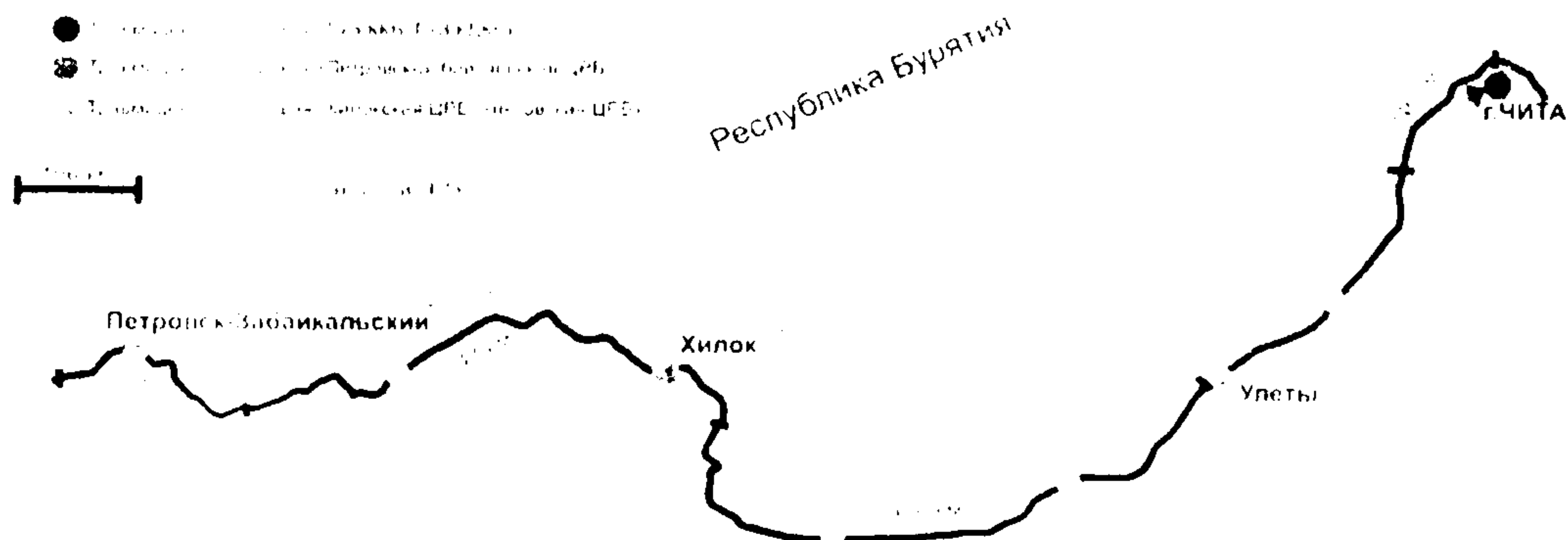
Схема доставки пострадавших в учреждения здравоохранения при ДТП на автодороге А-166 "Чита-Забайкальск"